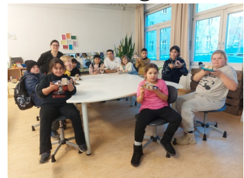
Starke Kinder AG