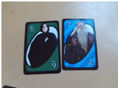
Harry Potter AG